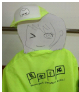
黄色い帽子と ジャンパーが 見守り隊の目 印です