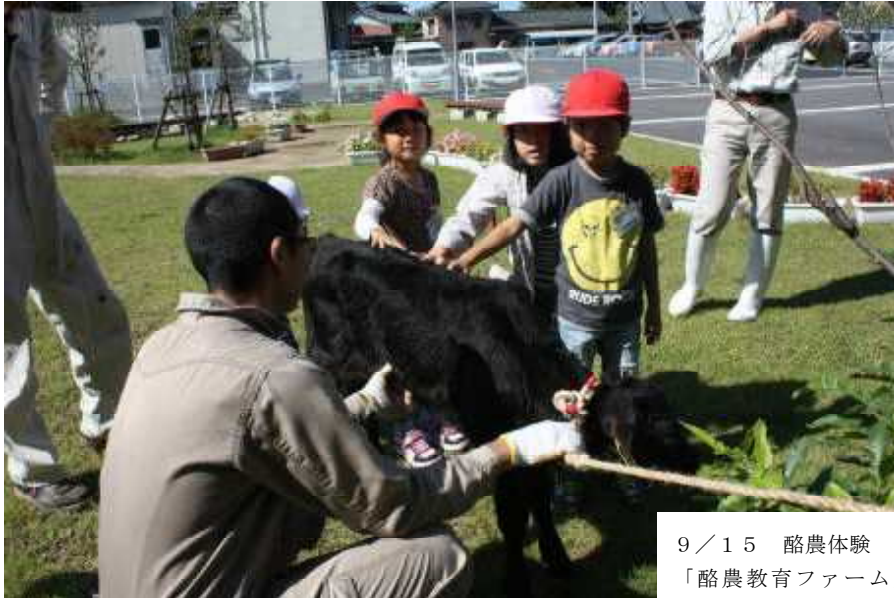
9 / 15 酪農体験 「酪農教育ファーム」